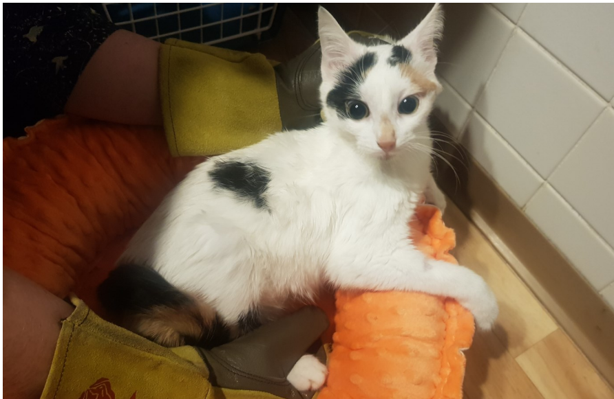
MILA – VON DER KRANKHEIT GEZEICHNET