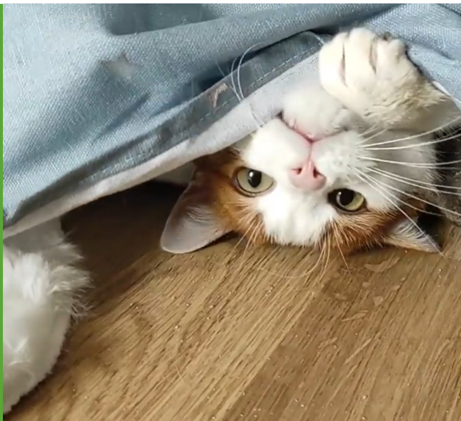
TIMO – CHRONISCHER SCHNUPFEN

079 896 79 09 kontakt@handicapcats.ch www.handicapcats.ch