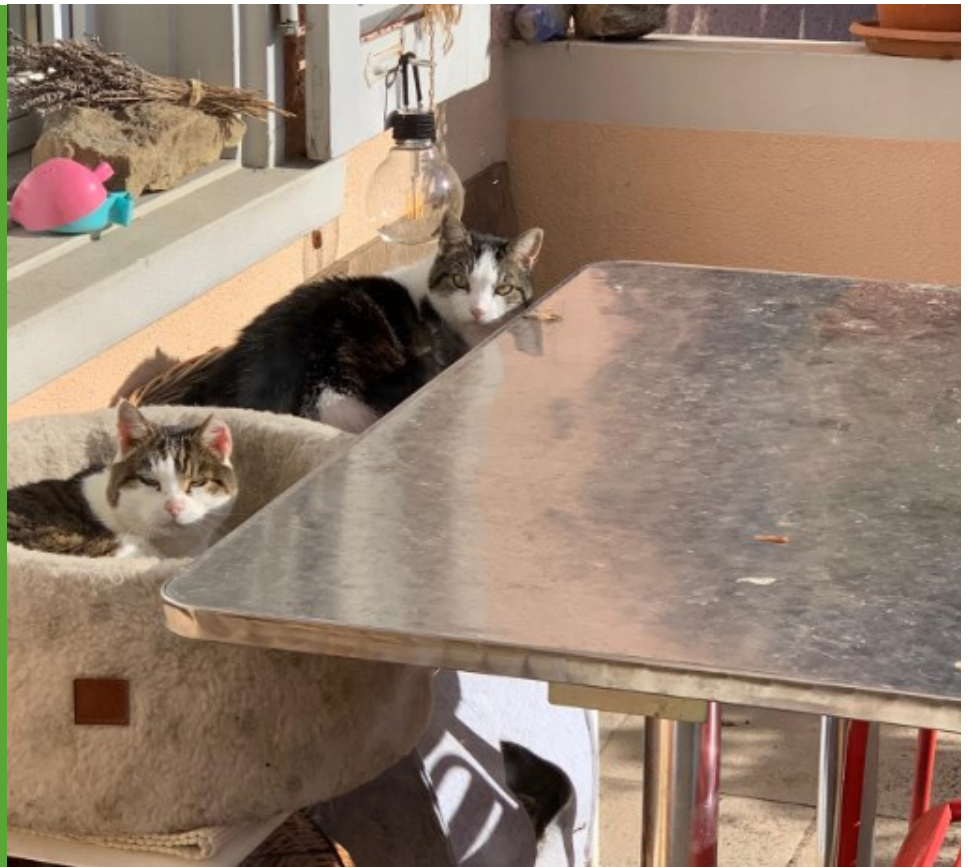
MAX (RECHTS) –SENIOR

Auch männliche Tiere sollen kastriert werden.