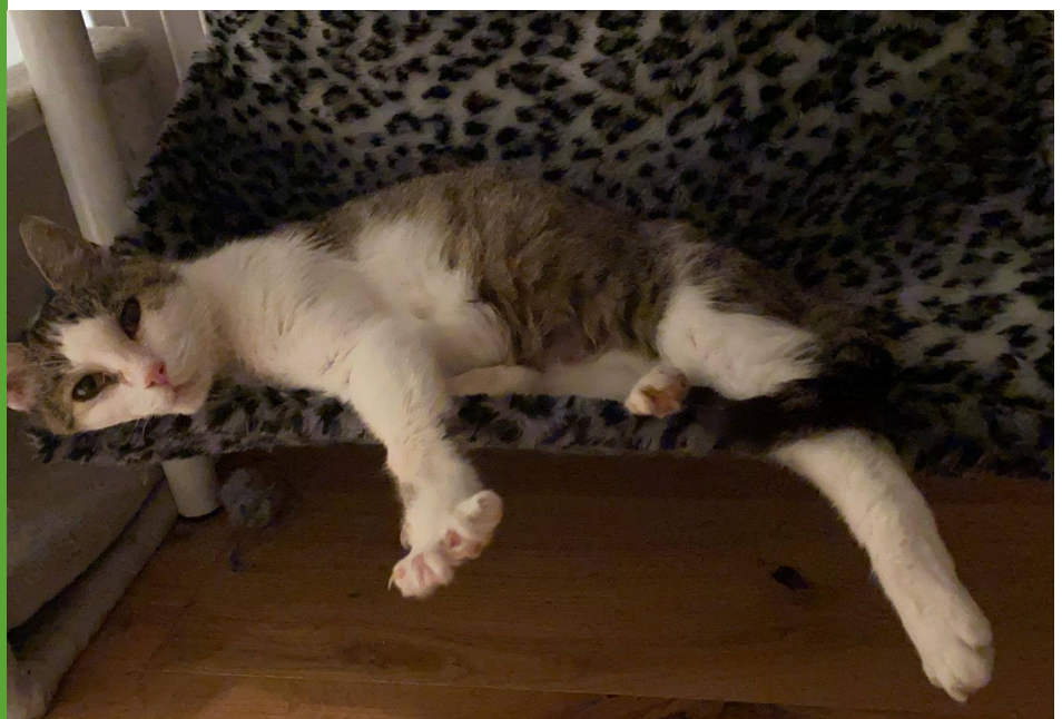
CLEO MIT WURMBAUCH