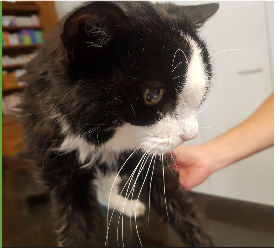
Missy –sie war etwas ganz Besonderes und hat im Nu unsere Herzen erobert. R.i.P

Sofort haben wir uns bereit erklärt die 22jährige, nierenkranke Katze Missy bei uns aufzunehmen. Missy litt bereits bei der Ankunft an einem Schnupfeninfekt. Dieser haben wir sofort behandelt. Sie lebte einige Wochen glücklich auf unserer Pflegestelle. Leider mussten wir jedoch bald Abschied von ihr nehmen. Wir sorgten dafür, dass sie friedlich in den Armen der Besitzerin einschlafen durfte.