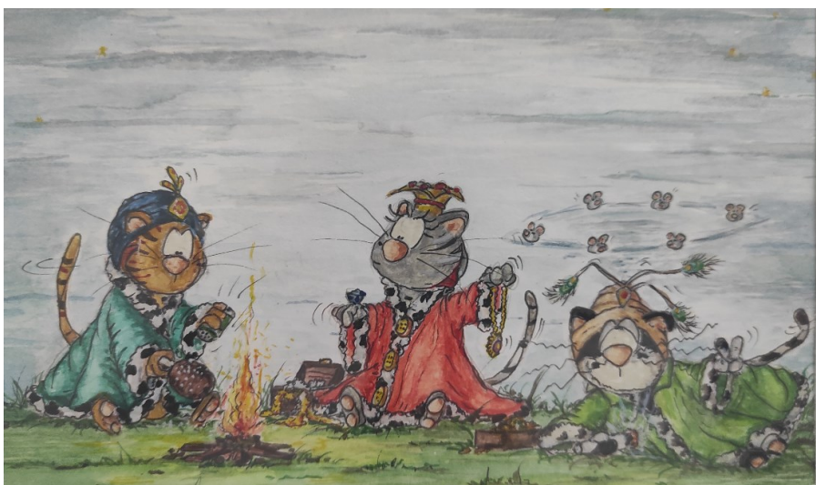
Die Unheiligen drei Könige von Ilka Danner

Wir haben ganz viele positive Rückmeldungen erhalten und das Ganze hat uns ca.800.00 CHF in die Spendenkasse gebracht. Unterstützt wurden wir zudem in der Adventszeit auch von der Illustratorin Ilka Danner aus Deutschland. Sie hat mit lustigen Geschichten, Gedichten und besonders tollen Zeichnungen viel Freude in die Adventszeit gebracht.