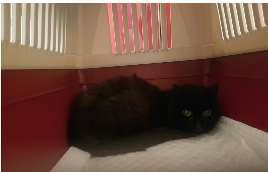
HOPE KURZ NACH DER EINFANGAKTION

Hope verweilt momentan immer noch auf unserer Pflegestelle. Sie scheint noch sehr müde zu sein und zeigt Dankbarkeit für die Unterstützung und die gewonnene Sicherheit die wir ihr geben. Wir werden sie nicht mehr am alten Ort auswildern. Ihr neues zuhause soll an einem Ort sein wo sie zwar nach draussen in die Freiheit darf—jedoch dabei von jemandem beobachtet wird. So, dass man reagieren könnte wenn ihr etwas fehlt.